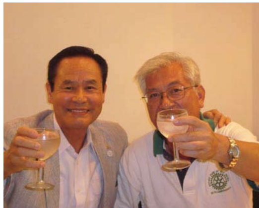
高島会員・星野会員