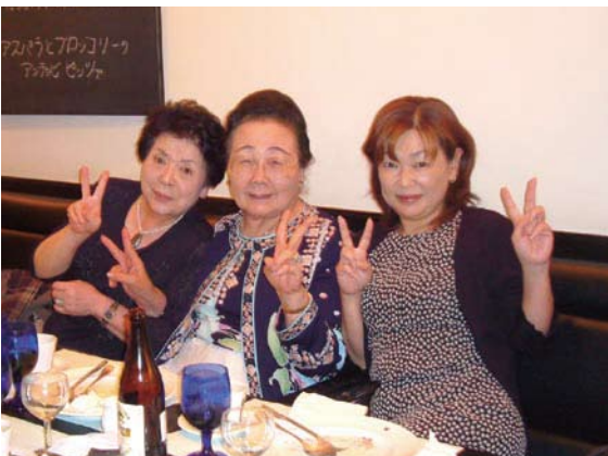
村越夫人・小野夫人・松丸事務局