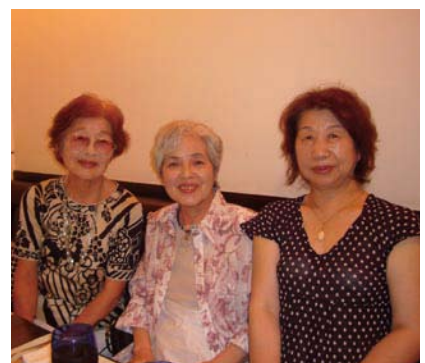
瀧日夫人・上村晃一夫人・星野夫人