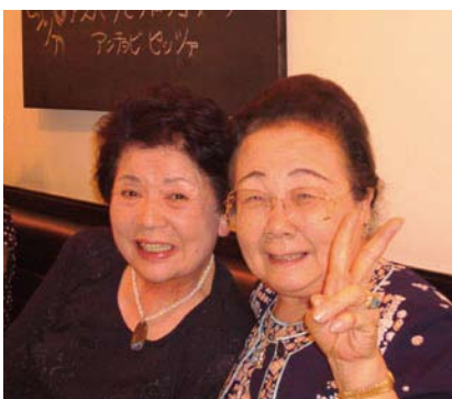
村越夫人・小野夫人