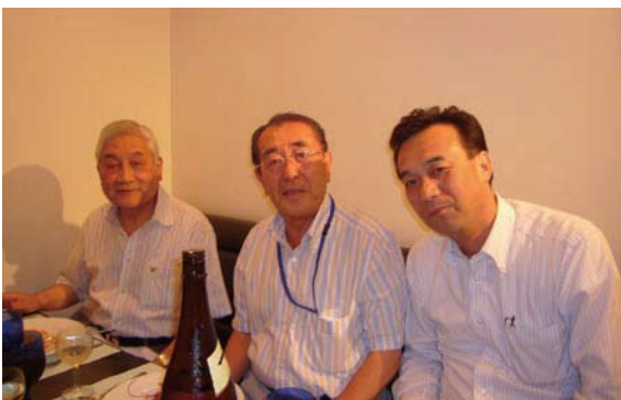
村越会員・瀧日会員・白石会員