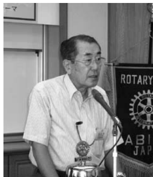
決算報告 滝日会員