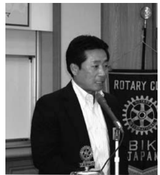
決算報告 小池会員